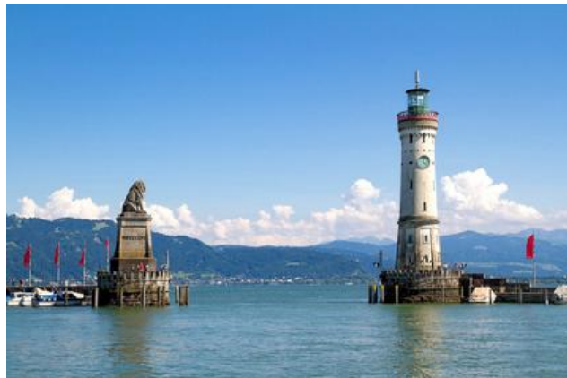
abendlichen Seeblick einprägen, beschließen wiederzukommen. (Alle Orte im Internet)

Vielleicht früher aufstehen, am Schweizer Ufer entlang, nach Konstanz segeln, zünftig Weißwurst "zuteln", mit kühlem Bier stärken, einer live Dixieland-Band zuhören, über Wallhausen, Bodman nach Ludwigshafen zurücksegeln, Yacht aufklaren, zum Abschied im Freien essen,